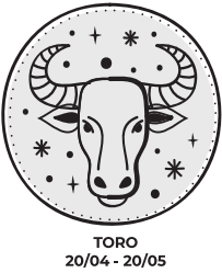
TORO 20/04 - 20/05