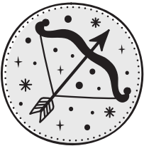
SAGITTARIO 22/11 - 21/12