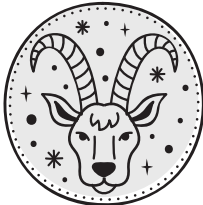
CAPRICORNO 22/12 - 19/01