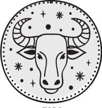
TORO 20/04 - 20/05