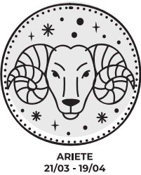
ARIETE 21/03 - 19/04